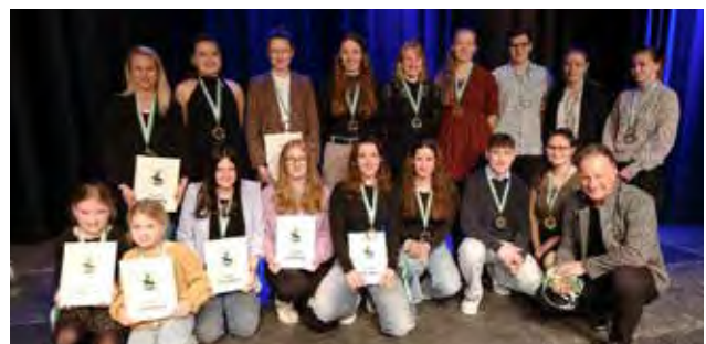
Erfolgreiches RSV-Team mit Landrat Robert Niedergesäß